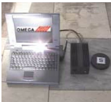
Abb. 3.3.1/2k): Fa. Selectronic: Auswerte-PC