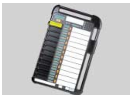
Abb. 3.3.1/2m): Dräger Safety: Merlin, Überwachungstafel für die Telemetrie