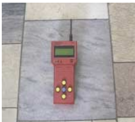
Abb. 3.3.1/2j): Fa. Selectronic, Handzentrale