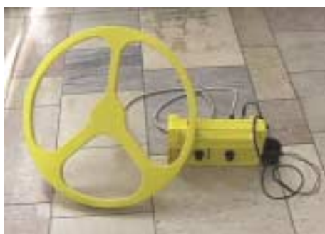
Abb. 3.3.1/2l): Fa. Selectronic: Personenortungsgerät (POG)