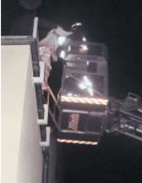
Abb. 11.2.1/7: Von einer Dachterrasse werden Personen (u.a. mehrere ängstliche Kinder) gerettet, da der Treppenraum verraucht ist. Relativ sichere Position, außerhalb des Gefahrenbereichs, insbesondere rauchfreie Lage.