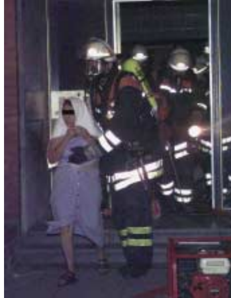
Abb. 11.2.1/8: Der Angriffstrupp bringt eine Person in Sicherheit.