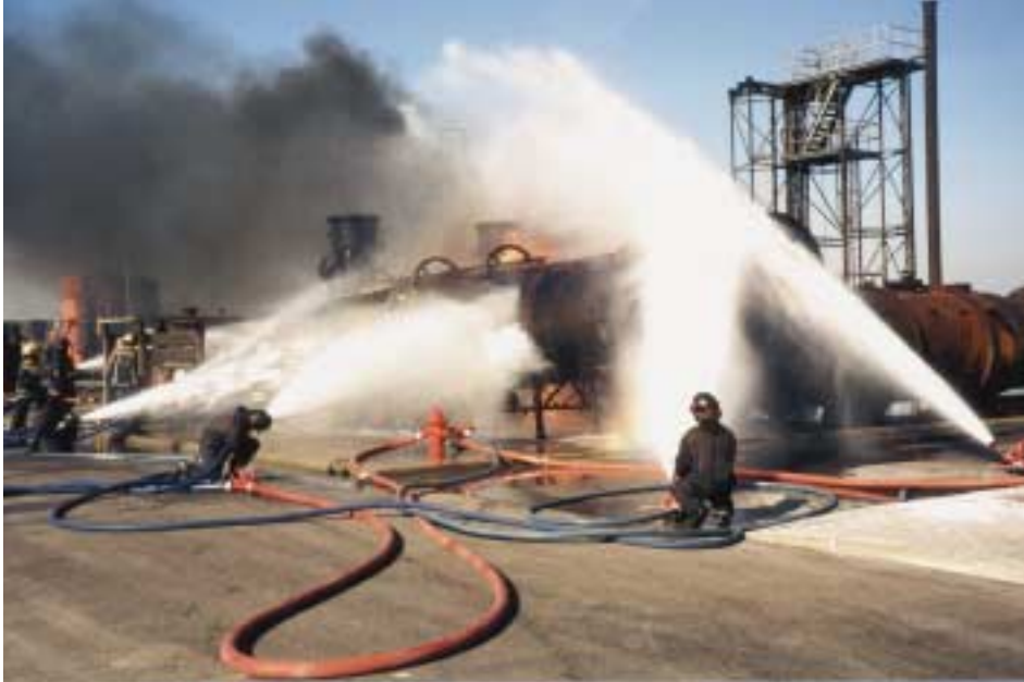
Abb. 13.1.1/1: Die Abschätzung des Löschwasserbedarfs ist nicht einfach und stark lageabhängig.