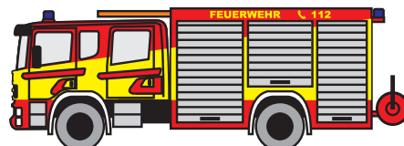
LF 16/12: Besatzung 1/5

Löschzug "neu" [real] = (6 + 2) FA (SB) + evtl. 6 FA (SB) = 8 ... 14 FA (SB)