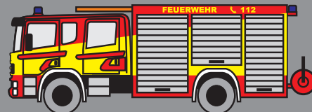
LF 16/12: Besatzung 1/5