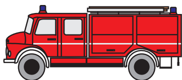
TLF 16/25: Besatzung 1/5

Löschzug "alt" [bzw. FwDV] = (6 + 6 + 9) FA (SB) = 21 FA (SB)