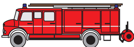
LF 16: Besatzung 1/8

Löschzug "neu" [real] = (6 + 2) FA (SB) + evtl. 6 FA (SB) = 8 ... 14 FA (SB)