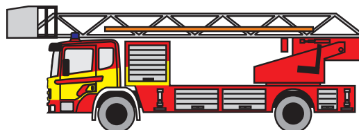
DLK 23-12: Besatzung 1/1