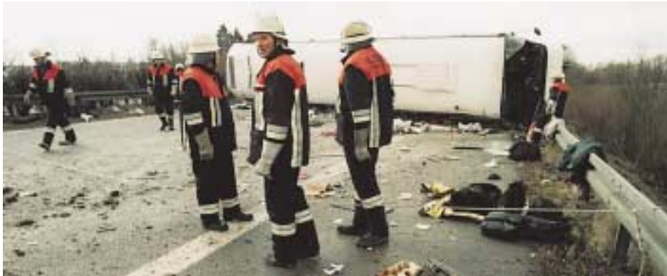
Abb. 2.1/9: Aufteilung der Einsatzstelle mit gespannten Feuerwehrleinen