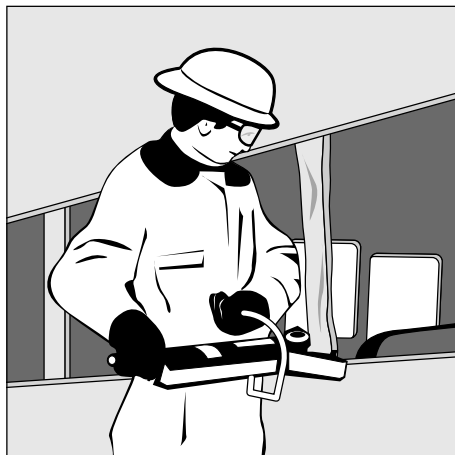
Abb. 2.6/2: Vergrößerte Fensteröffnung (Grafik: Cimolino)