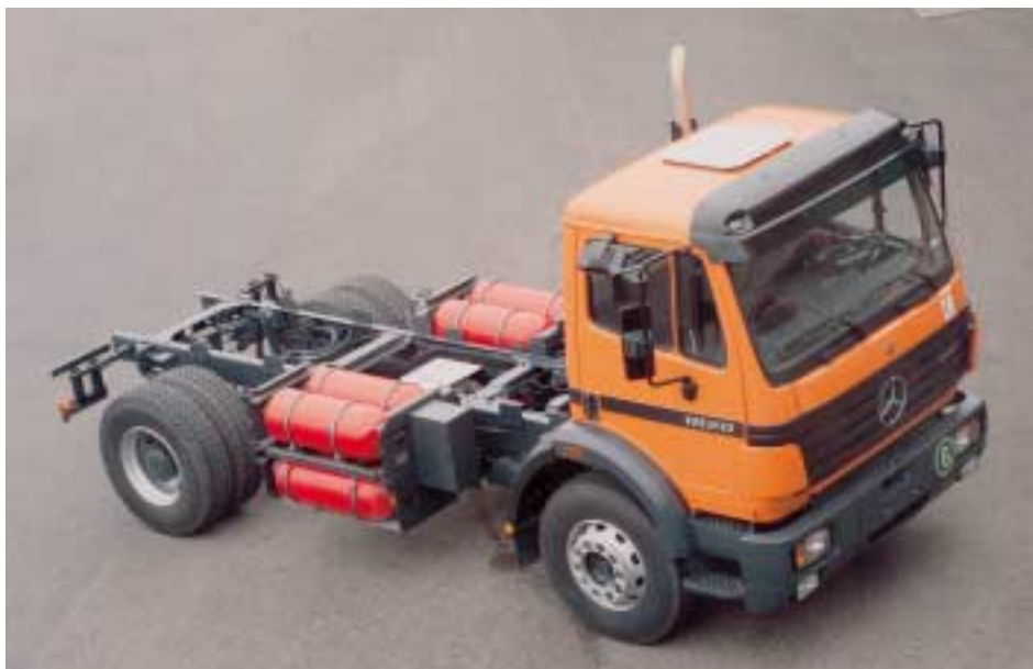
Abb. 3.5.3/5: LKW mit Erdgasantrieb, hier ein Versuchsfahrzeug