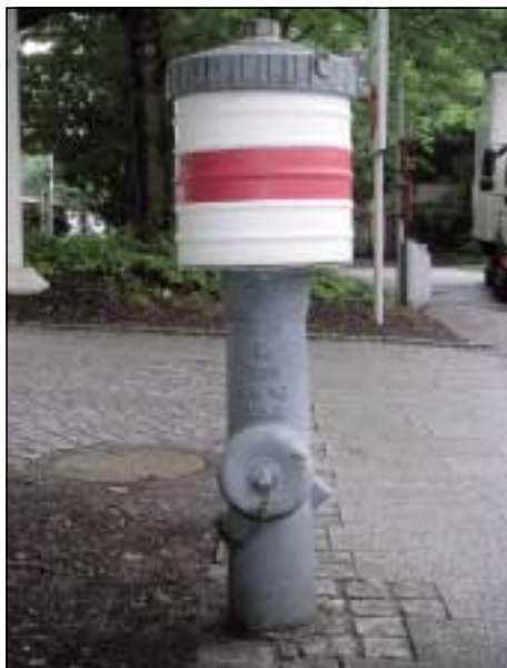
Abb. 3.3.2/25: Überflurhydrant